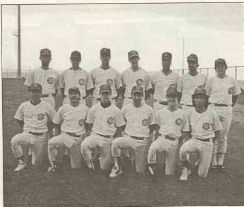
I Cubs Albisola si prepara per la stagione